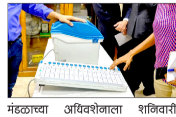
मंडळाच्या अधिवेशनाला शनिवारी

नुकत्याच झालेल्या विधानसभा निवडणुकीत ईव्हीएम मतदान यंत्रात मोठा घोटाळा झाला आहे. त्यामुळे मतपत्रिकेवर मतदान घेण्याच्या मागणीवर महाविकास आघाडीचे नेते आणि आमदार हे ठाम आहेत. नव निर्वाचित आमदारांच्या राज्य विधी