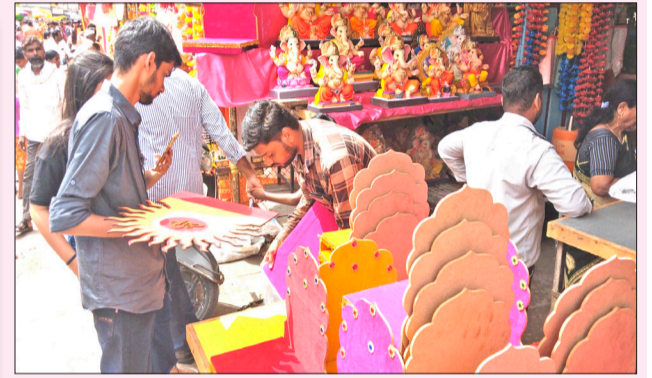
सोलापूर : गणपतीसमोर लागणाऱ्या आरसाचे साहित्य पाहताना भाविक.

शहराच्या मध्यवर्ती भागात भाविकांसाठी पोलीस मदत केंद्रे सुरु करण्यात येणार आहेत. तसेच, काही प्रमुख चौकांमध्ये मनोऱ्यावरून गर्दीतील गैरप्रकारांवर लक्ष ठेवण्यात येणार आहे.