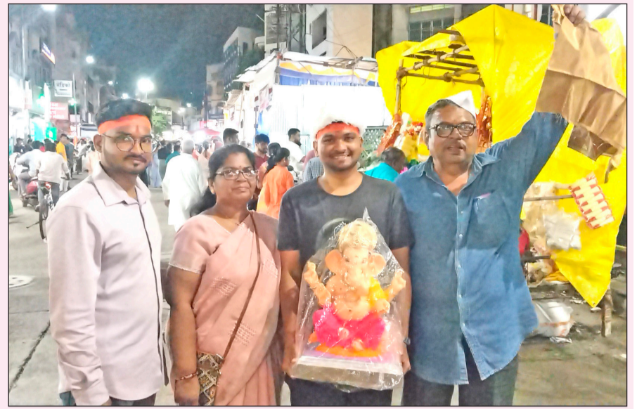
सोलापूर : अनेक भाविकांनी आदल्या दिवशी म्हणजेच शुक्रावारीच गणरायाची मूर्ती घरी नेली.