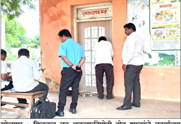
सोलापूर : मिळकत कर थकबाकीपोटी दोन शाळांचे कार्यालय सील करताना महापालिकेचे कर्मचारी.

६ सप्टेंबर २०२४ रोजी मालमत्ता कर विभागाकडील वसुली मोहिमेअंतर्गत विजापूर रोड, नेहरुनगर येथील मिळकत क्रमांक ३०१०८४ पोस्ट बेसिक आश्रम शाळा याची माहे सप्टेंबर