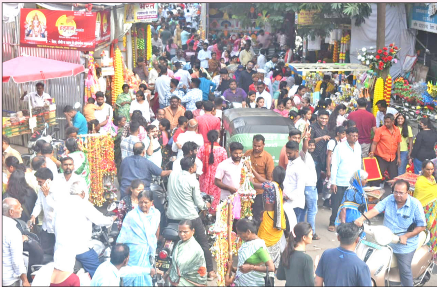
सोलापूर : गणेशोत्सवाच्या पूर्वसंध्येला शुक्रावारी शहरातील नवोपेठ भागात विविध वस्तू खरेदीसाठी भाविकांची झुंढ उडाल्याचे दिसून आले.