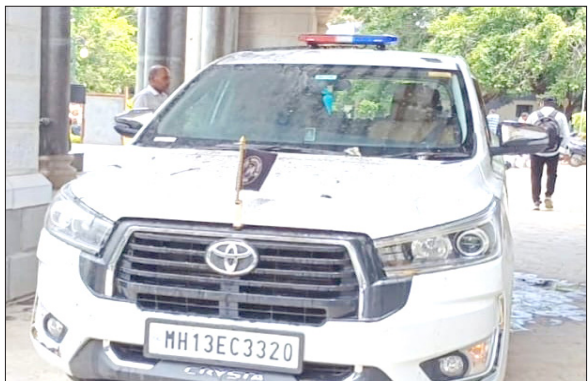
सोलापूर : भीम आर्मीच्या पदाधिकाऱ्यांनी आयुक्तांच्या गाडीवर अशाप्रकारे घाणीपाणी ओतले.

सम्राट चौक जवळ असलेल्या मातोश्री रमाबाई आंबेडकर नगरात अनेक घरांमध्ये ड्रेनेजचे पाणी पसरते. वारंवार तक्रार करूनही कार्यवाही होत नाही. महापालिकेत निवेदन घावला आले असता आयुक्त मीटिंगमध्ये असल्याने भेटणार नाहीत, असे सांगितल्यामुळे संतप्त भीम आर्मी भारत एकता मिशनच्या पदाधिकाऱ्यांनी महापालिका आयुक्तांच्या शासकीय गाडीवर ड्रेनेजचे पाणी ओतले आणि निषेधाच्या घोषणा दिल्या. नगरात अनेक घरांमध्ये ड्रेनेजचे पाणी पसरते. ड्रेनेज तुंबल्यामुळे घरात राहणे ही मुश्किल झाले आहे. वारंवार तक्रार करूनही कार्यवाही होत नाही. महिलांसह भीम