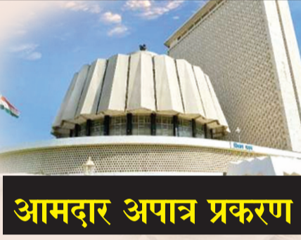
आमदार अपात्र प्रकरण

सांगितले आहे. शिवसेनेचे वकिलांनी हे प्रकरण लवकरात लवकर सुनावणी घेऊन निकाल द्यावा अशी इच्छा प्रकट केली. त्यावर सरन्यायाधीश संतापून मग तुम्हीच येऊन इथे बसा असे सुनावले. शिवसेनेच्या दोन्ही बाजूने संकलन दिव्यांतर ही