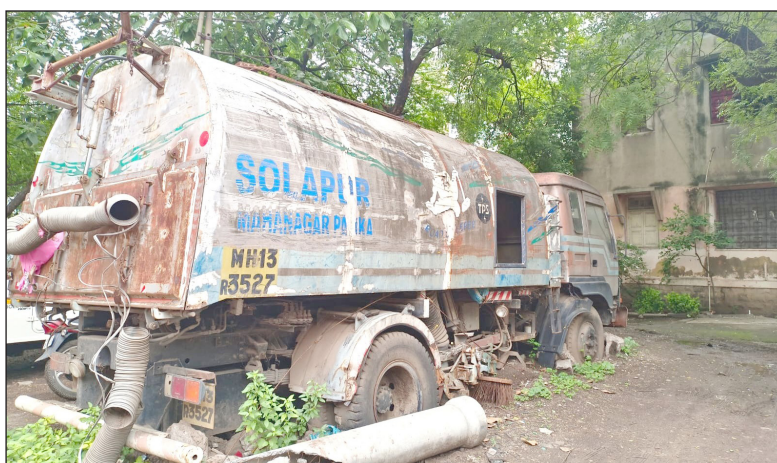
सोलापूर : डफरीन हॉस्पिटलच्या आवारात गंजत आणि धूळखात पडलेली रोड स्विपर मशीन.