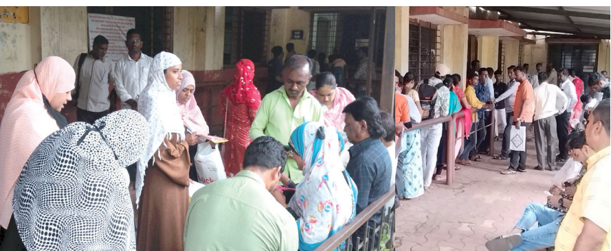
सोलापूर: विविध योजनांची कागदपत्रे काढण्यासाठी महिलांची सेतू कार्यालयात झालेली गर्दी.