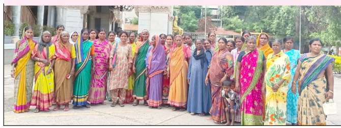
महापालिकेच्या अपुऱ्या सुविधांबाबत उपायुक्ताना निवेदन देण्यास आलेल्या महिला.

रस्ते, लाईट, झेनेज पाणीपुरवठ्याचा उडाला बोजवारा