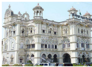
शहरातील रस्त्यांची यांत्रिकी पद्धतीने स्वच्छता करण्यासाठी सोलापूर महापालिकेने गेल्या तीन-चार वर्षांपूर्वी

लाखो रूपयांचे नुकसान; मशीन भंगारत काढायची वेळ