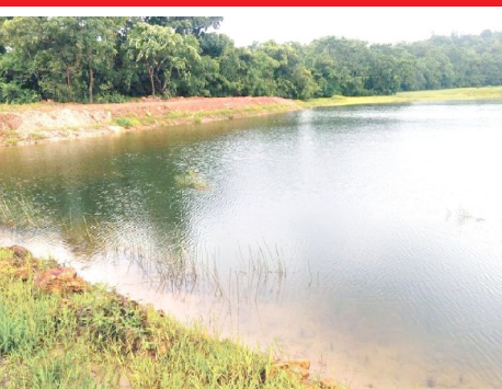
अधिक पाऊस पडला होता मात्र जून व ऑगस्ट महिन्यात फारच कमी पाऊस

शहर- जिल्ह्यात भरलेल्या तलावांची टक्केवारी