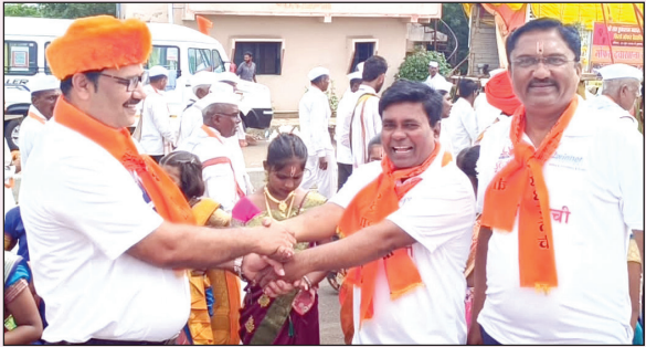
अकलूज : साक्षरता वारीत फुगडी खेळताना अधिकारी वर्ग.