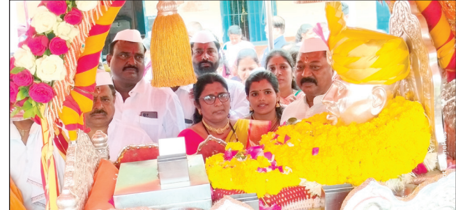
मंगळवेढा : श्री संत गजानन महाराज पालखीचे दामाजी कारखान्यातर्फे स्वागत करण्यात आले.

✓ मंगळवेढा : श्री संत गजानन महाराज शेगाव व संत सेवालाल महाराज विष्णू या पालख्यांचे मंगळवेढा नगरीत रविवारी (दि.१४) श्री संत दामाजी सहकारी साखर कारखान्यातर्फे स्वागत करण्यात आले.