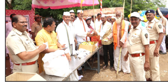
वेळापूर : खुद्दस येथे सोलापूर वन विभाग व सामाजिक वनीकरण यांच्यावतीने वारकरी बांधवांना बीज गोळे व अन्नदान वाटप करण्यात आले.

सोलापूर वन विभाग व सामाजिक वनीकरण यांच्या संयुक्त विद्यमाने पालखी मधील