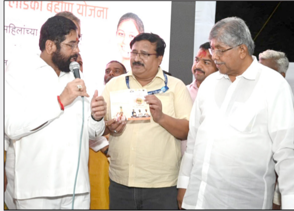
पंढरपूर : 'संवाद वारी' या प्रसिद्धी पत्रकाच्या प्रकाशन प्रसंगी मुख्यमंत्री शिंदे, मंत्री चंद्रकांत पाटील यांना दारखवताना अधिकारी. पालखी व जगद्गुरु श्री तुकाराम महाराज पालखी यांच्या समवेत

शासकीय योजनांची प्रसिद्धी करत इथपर्यंत आलेला आहे. त्यामुळे या पालख्या समवेतच्या प्रवासातील विसावा व मुक्कामाचे ठिकाणी व पालखी मार्गात वेगवेगळे विविध गावातील नागरिकापर्यंत शासकीय योजना पोहोचवण्यास मदत झालेली आहे. माझी लाडकी बहीण योजना ही अशा प्रसिद्धीमुळेच तळगाळापर्यंत पोहोचत आहे. माहिती विभागाचे प्रचार प्रसिद्धीचे कामही चांगले असल्याचे त्यांनी यावेळी सांगितले.