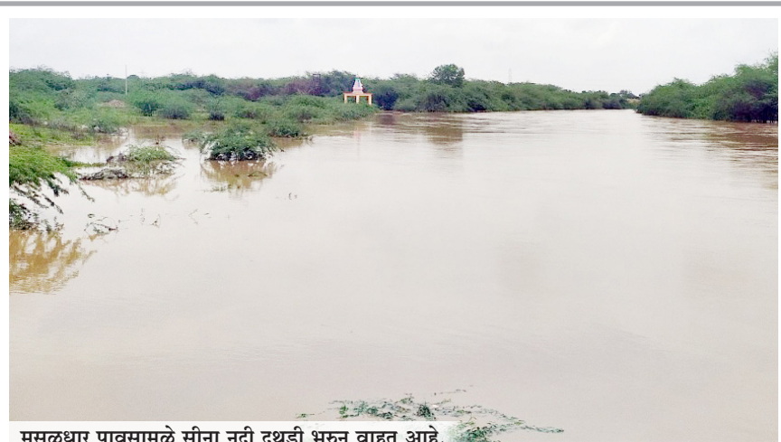
मुसळधार पावसामुळे सीना नदी दुथडी भरून वाहत आहे.