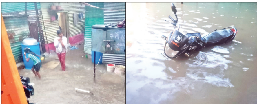
जय महलार नगरातील घरात शिरलेले पाणी

सोलापूर शहर परिसराला मृग नक्षत्राच्या पावसानं रविवारी अक्षरशः झोडपून काढले. सायंकाळी साडेपाच वाजता सुरु झालेला पाऊस रात्री साडेनऊनंतरही कोसळतच होता. साडेपाच ते साठआठ या दरम्यान तब्बल ७२.८ मि.मि. इतक्या विक्रमी पावसाची नोंद हवामान विभागाकडं झाली. सलग तब्बल साडेचार तासांहून अधिक पडलेल्या मोठ्या पावसानं सोलापुरात दाणादाण उडाली. गटारी तुंबल्यानं सकल भागासह झोपडपट्यांमधील घरांमध्ये पाणी घुसून नागरिकांचे संसार पाण्यात बुडाले. रहिवाशांची त्रेधातिरपीट उडाली. 'पाणी घरातसुद्धा अन् डोळ्यातसुद्धा' असे वास्तव निर्माण झाले.