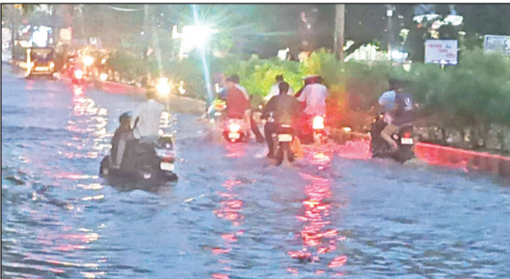
होटगी रोडवर पावसाच्या पाण्याने तळ्याचे स्वरूप धारण केले होते.