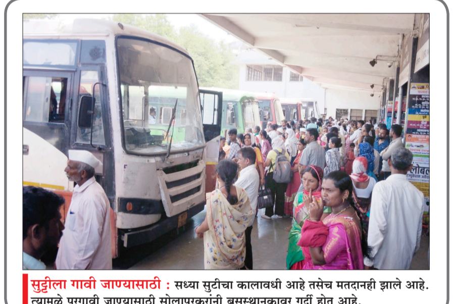
सुड्डिला गावी जाण्यासाठी : सध्या सुटीचा कालावधी आहे तसेच मतदानही झाले आहे. त्यामुळे परगावी जाण्यासाठी सोलापूरकरांनी बसस्थानकावर गर्दी होत आहे.