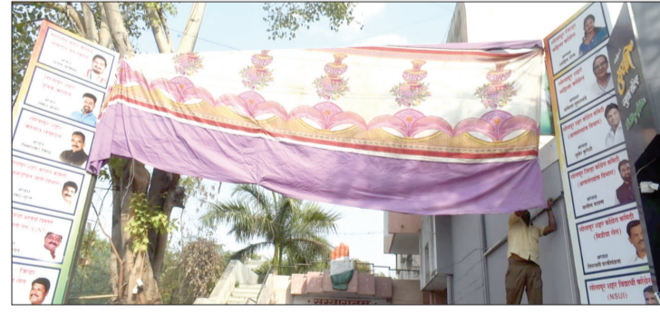
सोलापूर : लोकसभा निवडणुकीची आचारसंहिता लागल्यानंतर पक्ष कार्यालयासमोर फलकांवरील नेतेमंडळींच्या छबी झाकताना पक्षाचे कार्यकर्ते.

२०२४ चा लोकसभा निवडणुकीचा कार्यक्रम आज घोषित होणार यासंबंधीची माहिती कालच शुक्रवारी निवडणूक आयोगाच्यावतीने देण्यात आली होती. त्यामुळे आदर्श आचारसंहितेच्या सावटाखाली जाणारी कामे तातडीने पूर्ण करण्यासाठी आजदेखील दुपारी दोन-अडीच वाजेपर्यंत सोलापूर शहरातील मुख्यत्वे, जिल्हाधिकारी, जिल्हा परिषद, दक्षिण आणि उत्तर सोलापूर तहसीलदार आणि पंचायत समिती कार्यालये, भीमा