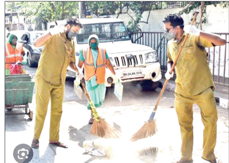
पंढरपूरमध्ये सफाई कर्मचाऱ्यांना स्वच्छता करताना घ्यावयाची काळजी व सुरक्षा साधनांची माहिती प्रात्यक्षिकांद्वारे देण्यात आली.