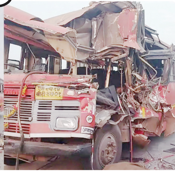
माळशिरस तालुक्यातील वटपळीजवळ चक्काचूर झालेली एसटी

गुरुवारचा दिवस घातवार ठरला. सोलापूर जिल्ह्यात वेगवेगळ्या दोन ठिकाणी अपघात झाले, तेही पहाटेच्या सुमारास. त्यात एका शिक्षकासह दोघे ठार झाले असून १७ जण जखमी झाले. एका शाळेतील शिक्षक आणि विद्यार्थी सहल करून आपल्या गावी चालले होते परंतु या सहलीचा आनंद क्षणिक ठरला. एसटी चालकाचा ओव्हरस्टेक करण्याचा प्रकार अंगलट आला. एसटी आयशर ट्रकवर आदळून त्यात एका शिक्षकाचा जागीच मृत्यू झाला. अन्य दोघे शिक्षक व दोन विद्यार्थी जखमी झाले तर एका टम्पो चालकाची डुलकी एकाच्या जिवावर बेतली. टम्पो रस्त्यावरच उलटला.