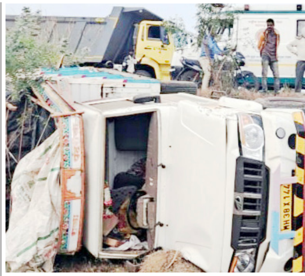
कुईवाडी-शेटफळ रस्त्यावर उलटलेला टम्पो

शिवाजी विद्यालय (बावडा, ता. इंदोली, जि. पुणे) या शाळेची सहल कोकण दर्शनसाठी दि. १९ डिसेंबर रोजी मध्यरात्री रवाना झाली. पुणे जिल्ह्यातील या शाळेने अकलूज बस आगाराकडून तीन बस सहलीसाठी प्रासंगिक करावाय घेतल्या होत्या. दि. १९ ते २१