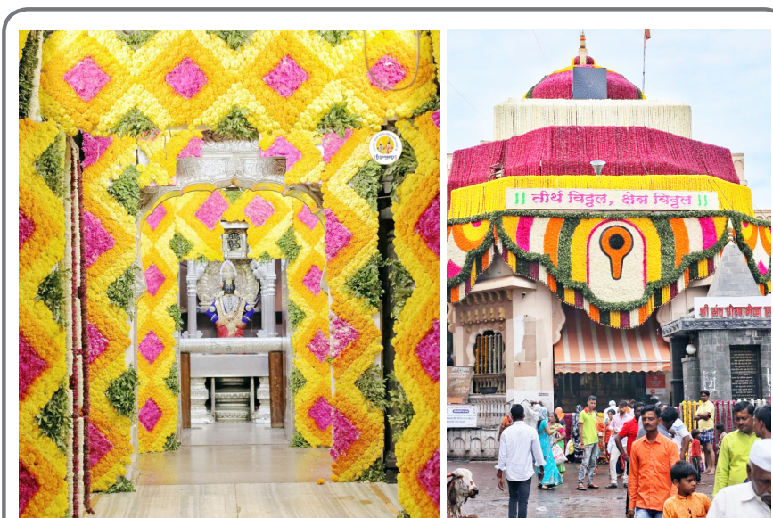
पंढरपूर: श्री विठ्ठल रुक्मिणी मंदिर समितीच्यावतीने प्रशाळपुजेनिमित्त गांधारा, संत नामदेव पायरी, विठ्ठल सभामंडप, रुक्मिणी माता सभामंडपासह संपूर्ण मंदिरात आकर्षक अशी फुलाची सजावट केली होती.