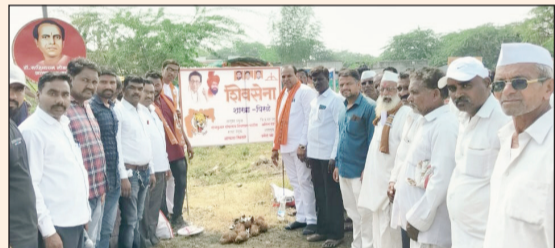
नातेपुते : पिराळे येथे शिवसेना शिंदे गटाच्या शाखेचे उद्घाटन करण्यात आले. त्याप्रसंगी उपस्थित मान्यवर.