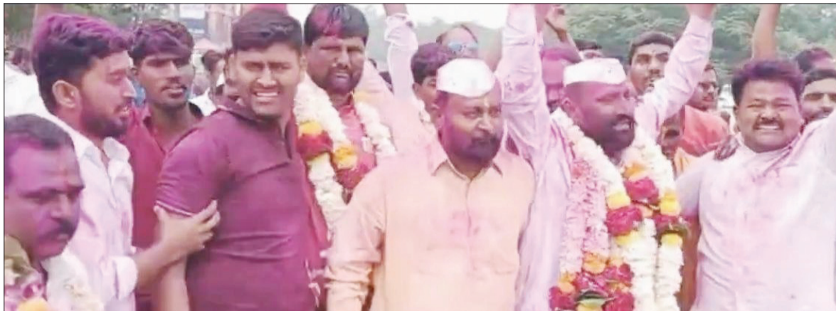
पंढरपूर : पंढरपूर तालुका ग्रामपंचायत निवडणुकीत विजयी जल्लोष करताना ईश्वर वठारमधील विजयी उमेदवार.