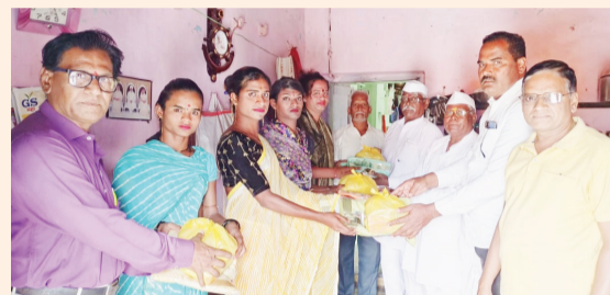
सांगोला : सांगोला येथील आपुलकी प्रतिष्ठानच्यावतीने तृतीयपंथीयांना दिवाळी फराळासह कपडे देऊन त्यांच्या दिवाळीचा आनंद द्विगुणित केला.