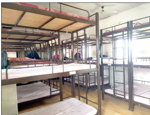
अक्कलकोट: श्री स्वामी समर्थ अन्नछत्र मंडळाने पाच वर्षापूर्वी उभारलेले अद्यावत विश्रांती कक्ष आणि वाहनतळाचे छायाचित्र. यामुळे वाहन धारक, भाविकांची मोठी गैरसोय दूर झाली आहे. वाहन चालकांना विश्रांती मिळणार आहे.