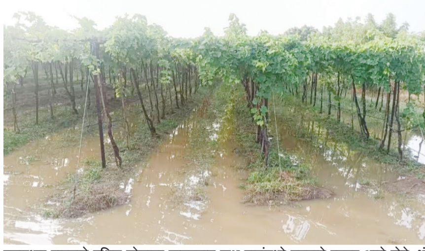
मुसळधार पावसाने दक्षिण सोलापूर तालुक्यात द्राक्ष बागांमध्ये तळ्याचे स्वरूप आले होते. भंडारकवटे भागात ज्वारीचे पीक आडवे झाल्याचे दृश्य.

सुराज्य/सोलापूर सोलापूर शहरासह जिल्ह्याला मंगळवारी मध्यरात्री मुसळधार पावसाने झोडपून काढले. या अवकाळी पावसाने सर्वच तालुक्यांमधील खरीप आणि रब्बी पिकांची मोठ्या प्रमाणात हानी झाली आहे. वादळी वाऱ्यामुळे ज्वारीचे पीक आडवे झाले असून हरभऱ्यावरचा फुलोरा गळून पडला आहे. जोरदार पावसामुळे शहराच्या कुंभारवेसमधील नाल्याला पाणी आले होते. त्यात वाहून गेल्याने एका तरुणाचा मृत्यू झाला.