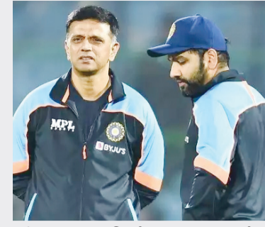
द्रविडच्या अनुपस्थितीत लक्ष्मण भारतीय संघाला घडे देणार आहे. राहुल द्रविड यांनी

मुंबई : राहुल द्रविड भारतीय संघाचा मुख्य कोच म्हणून काम पाहणार आहे. बीसीसीआयने याबाबत अधिकृत माहिती दिली. राहुल द्रविडसह सर्व सपोर्ट स्टाफचा कालावधी वाढवण्यात आला आहे. वनडे विश्वचषका २०२३ च्या फायनलनंतर राहुल द्रविडचा कार्यकाळ संपला होता. बीसीसीआयने राहुल द्रविड याला कार्यकाळ वाढवण्याची विनंती केली होती. राहुल द्रविड यानेही ही ऑफर स्विकारली आहे. व्हीव्हीएस लक्ष्मण एनसीए प्रमुख म्हणूनच काम पाहणार आहे. त्याशिवाय तो स्टॅंड इन मुख्य कोच असेल. म्हणजेच, राहुल