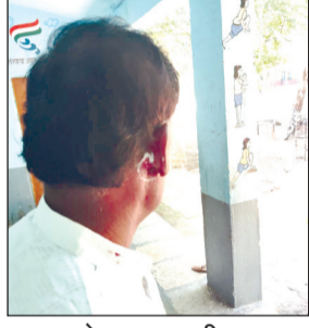
बेदम मारहाणीत मुख्याध्यापकाचे कान फाटले

मुख्याध्यापकावर सोलापूरच्या शासकीय रुग्णालयामध्ये उपचार सुरू आहेत. घटनेचे गांभीर्य लक्षात घेऊन गावातील प्रतिष्ठित नागरिक व लोकप्रतिनिधींनी रुग्णवाहिकेला पाचारण करून त्यांना तात्काळ दवाखान्यात दाखल केले.