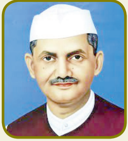
लालबाहादूर शास्त्री जयंती निमित्त अभिवान