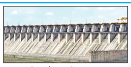
उजनी टक्केवारी +२०.२५ दोंड विसर्ग १२,२२० क्युसेक

बाळकुम परिसरात असलेल्या रुणवाल आयरीन या ४० मजली इमारतीवरून लिफ्ट कोसळून पाच कामगारांचा जागीच मृत्यू झाला. तर या अपघातात गंभीर जखमी झालेल्या दोन