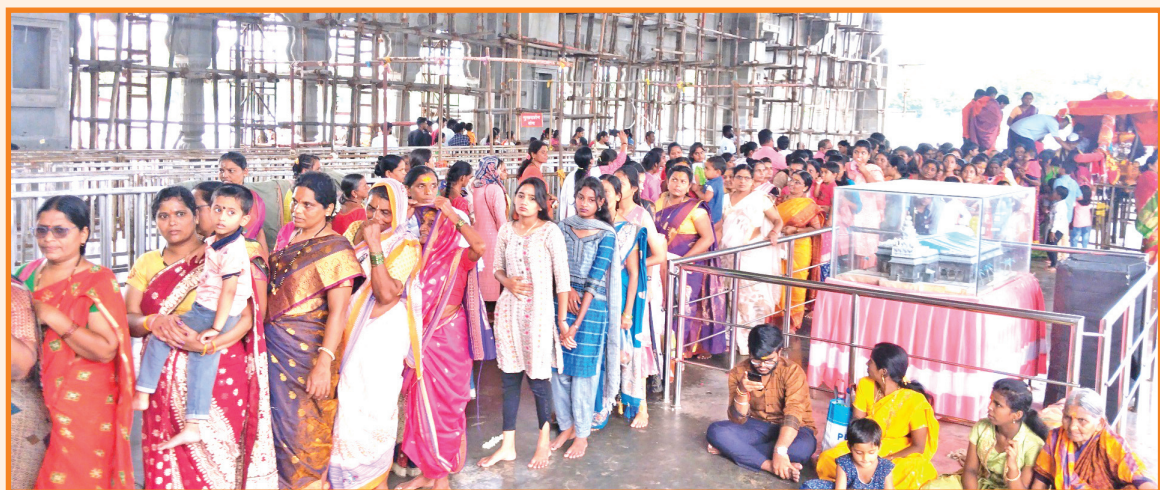
सोलापूरचे ग्रामदैवत श्री सिद्धेश्वर मंदिरात श्रावण रविवारनिमित्त दर्शनासाठी भाविकांचा उत्साह दिसून आला.