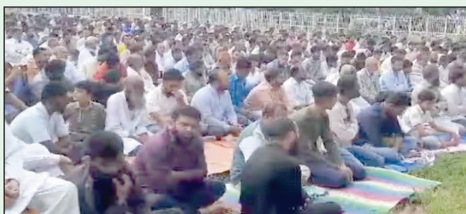
आयोजन करण्यात आले होते. यामध्ये पावसासाठी प्रार्थना केली. जेव्हा दुष्काळजन्य परिस्थिती

निर्माण झाली आहे. त्यामुळे पावसासाठी रविवारी मुस्लिम बांधवांतर्फे विशेष नमाज पठण करण्यात आले आहेत. हदिस संपटनेतर्फे रंगभवन इंदगाह येथे पावसासाठी या विशेष नमाजेचे