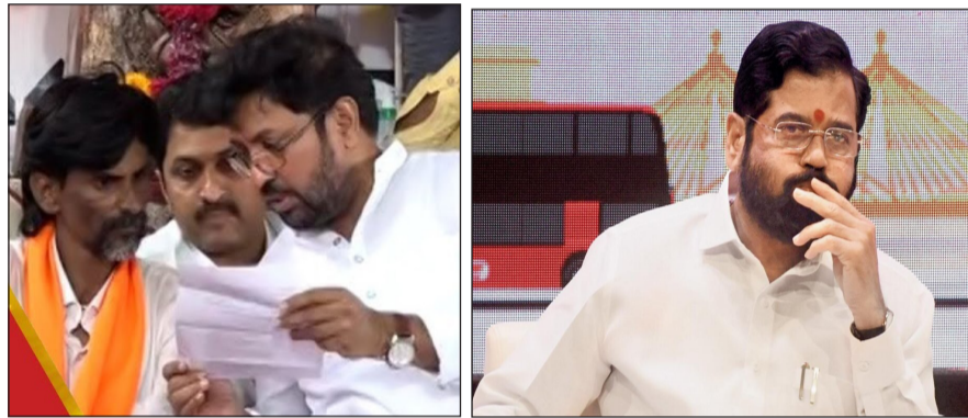
सरसकटचा आदेश काढा... सरकारने पहिला जीआर