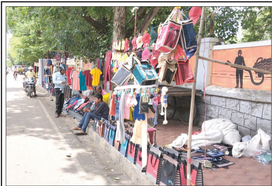
महापालिकेने अतिक्रमण मोहीम धडाक्यात सुरु केली आहे. अनेक ठिकाणचे अतिक्रमण काढले जात आहेत. मात्र वर्षानुवर्षे रंगभवन येथे फूटपाथवर असणारे अतिक्रमण महापालिकेला अजून दिसले नाही का असा प्रश्न उपस्थित होत आहे.