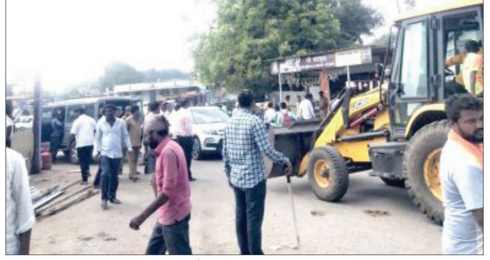
पाऊस नसल्याने दुकाळी परिस्थिती निर्माण झाली असताना सर्वत्र नागरिक हे हवालदिल झाले आहेत. अशा भीषण परिस्थितीमध्ये गोरगरिबांच्या जखमेवर मीठ चोळण्याचे काम नगरपरिषदेकडून सुरू आहे. नगर परिषदेने रहदारी व वाहतुकीस अडथळा ठरणारे

विरोध केला. अतिक्रमण काढण्याचा अगोदर अक्कलकोट नगर परिषदेकडून छोट्या व्यावसायिकांना अल्प दरात पचाव जागा, छोटे मोठे गाळा देऊन मग अतिक्रमण काढायला पाहिजे होते, पण नगरपरिषद प्रशासन या गोरगरीब व्यवसायिकांचा विचार कराव्यास तयार नसल्याचे दिसत आहे.