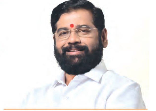
एकनाथ शिंदे मुख्यमंत्री