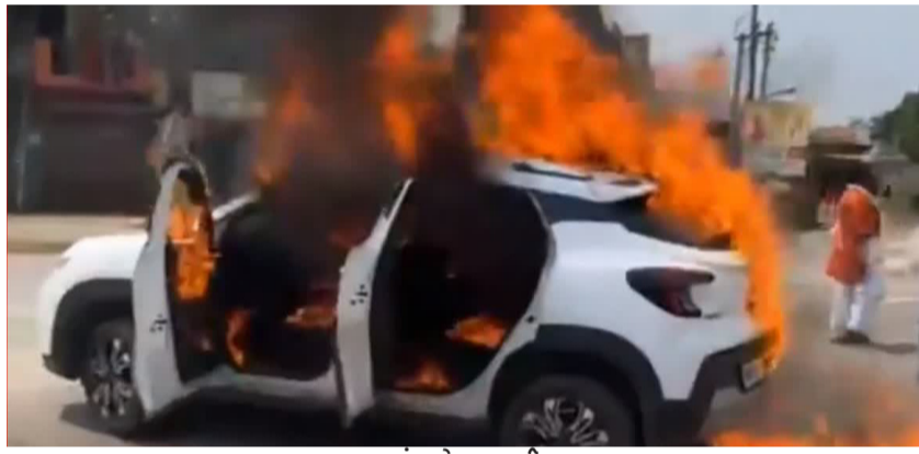
सरपंचाने जाळली कार

राज्यातील मराठा नेते लाठीचार्ज झालेल्यांची विचारपूस करण्यासाठी सराठी गावात जात आहेत. यातच उदयनराजे भोसले यांनीसुद्धा सराठी गावाला भेट दिली असून, त्यांनी यावेळी मराठ्यांच्या सहजशीलतेचा अंत पाहू नका असा इशारा द्या. उदयनराजे भोसले यांनी दिला आहे.