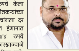
जमिनीवर गेले. त्या ठिकाणी त्यांनी या प्रकरणी तडजोड करण्यासाठी व त्यांच्या बाजूने निकाल देण्यासाठी १५ लाख रुपयांची मागणी केली होती.