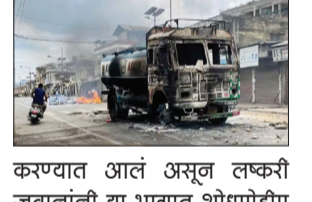
करण्यात आलं असून लष्करी जवानांनी या भागात शोधमोहीम सुरू केली आहे. बंदुकीची गोळी लागून जखमी झालेल्या एका बंडखोराला लष्कराने ताब्यात घेतलं आहे. सुरक्षा दलातील सृजांनी एनडीटीव्हीला सांगितलं की, 'या भागात शनिवारी सायंकाळी झालेल्या हत्यांपैकी दोन

गेल्या तीन महिन्यांपासून मणिपूरमध्ये सुरू असलेला हिंसाचार थांबण्याचं नाव येत नाहीये. गेल्या २४ तासांत मणिपूरमधील तणावग्रस्त भागात पिता-पुत्रासह एकूण सहा जणांचा मृत्यू झाला आहे. शनिवारी सकाळपासून बिष्णुपूर-चुराचांदपूर सीमा भागात मोठ्या प्रमाणात हिंसाचार सुरू आहे. या भागात झालेल्या हिंसाचारात १६ जण जखमी झाले आहेत. त्यामुळे या भागात लष्कराला पाचराज जणांना खूप जवळून गोळ्या घातल्या आहेत. तसेच त्यांना गोळ्या घालण्यापूर्वी त्यांच्या शरीराच्या वेगवेगळ्या भागांवर धारदार शस्त्रांनी वार करण्यात आले होते. दरम्यान, राज्यातील अनेक भागांमध्ये कायदा आणि सुव्यवस्थेचा प्रश्न निर्माण झाला आहे. परिणामी आज (६ ऑगस्ट) इंधक पूर्ण आणि इंधक पश्चिम जिल्ह्यांमध्ये संचारबंदीमध्ये कोणतीही शिथिलता दिली जाणार नसल्याचं सांगितलं जात आहे.