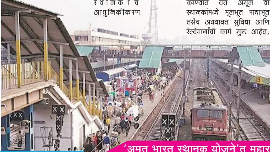
स्थानकांचे आधुनिकीकरण करण्यात येत असून या स्थानकांमध्ये मूलभूत पायाभूत तसेच अत्यावश्यक सुविधा आणि रेल्वेमागची कामे सुरू आहेत.

देशातील रेल्वे स्थानकांच्या आधुनिकीकरणासाठी राबविण्यात येणाऱ्या 'अमृत भारत स्थानक' योजनेचा शुभारंभ रविवारी पंतप्रधान नरेंद्र मोदी यांच्या हस्ते झाला. या योजनेत महाराष्ट्रातील ४४ रेल्वे स्थानकांचा समावेश केल्याबद्दल मुख्यमंत्री एकनाथ शिंदे यांनी पंतप्रधान नरेंद्र मोदी आणि केंद्रीय रेल्वेमंत्री अश्विनी वैष्णव यांचे आभार मानले आहेत.