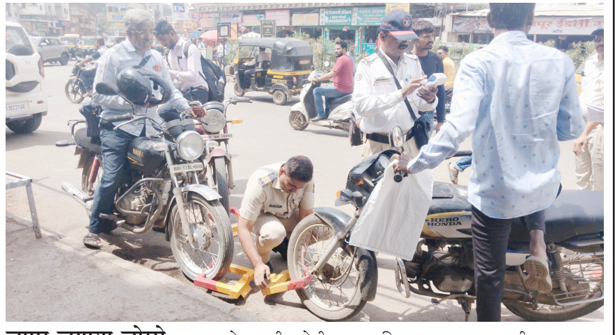
जामर लगाया जोरसे.... : सोलापुरातील बेरोशस्त वाहतुकीला आळा घालण्यासाठी शहर वाहतूक शाखेने नवी शकळ वाढवली आहे. शिवाजी चौकात मंगळवारी विरूद्ध दिशेने येणाऱ्या दोन दुचाकीस्वारांच्या गाड्या पकडून दोन्ही गाड्यांच्या पुढच्या चाकाला जामर लावून रोख लाबला.