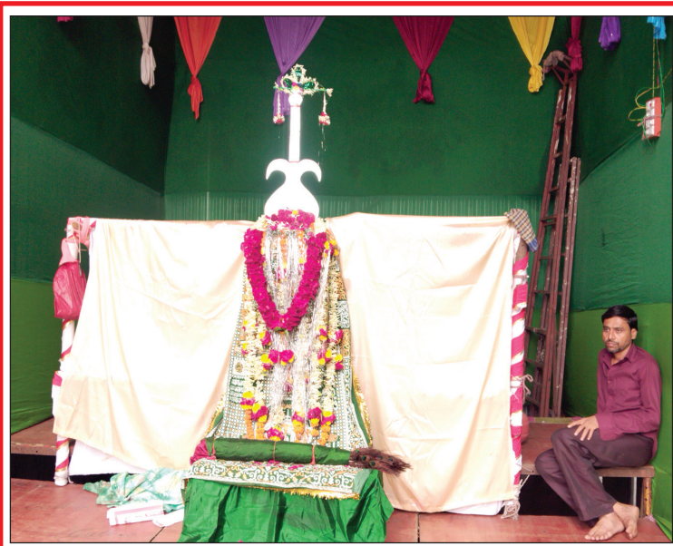
मुस्लिम बांधवांचा मोहरम सण जवळ आला आहे. त्यानिमित्त शहरात विविध ठिकाणी पंजाची स्थापना करण्यात आली आहे. बाळीवेस भागातील छायाचित्र.

असल्याने त्यांच्याशी भाजपला महापालिका निवडणुकीत तडजोड करावीच लागणार आहे, असे बोलले जात आहे. असे झाल्यास सोलापूर भाजपाची मोठी गोची होणार आहे. अधिक भाजपाकडे इच्छुकांची संख्या जास्त आहे. अशातच त्यांना आता शिवसेना आणि राष्ट्रवादीला जागा सोडवण्याला लागणार आहेत. सध्या शिवसेना (शिंदे गट) आणि राष्ट्रवादीची ताकद कमी दिसत आहे. मात्र पुढील काळात कोणत्या मोठ्या नेत्यांना सेना अथवा राष्ट्रवादीत प्रवेश केला तर राजकीय समिकरण पुन्हा बदलणार आहे. सध्याच्या राजकारणात काहीही होऊ शकते हे मागिल साहेतीन-चार वर्षात सर्वांनी पाहिले आहे. त्यामुळे कार्यकर्त्यांनी संभ्रमावरथेत आहेत. त्यामुळे ते आता राज्य आणि केंद्राच्या राजकारणात लक्ष न घातता आपापला प्रभाग सेफ कसा होईल याचे नियोजन करत आहेत.