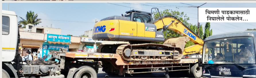
चिमणी पाडकामासाठी निघालेले पोकलेन...