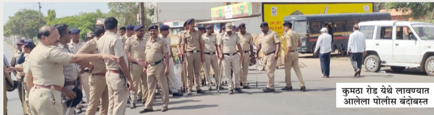
कुमठा रोड येथे लावण्यात आलेला पोलीस बंदोबस्त

दरम्यान, या प्रक्रियेदरम्यान कोणताही अलुचित प्रकार घडलेला नाही. दरम्यान, सिमेंट कॉन्क्रीटची असणारी ही चिमणी पाडण्यासाठी विविध टप्प्यावर बुधवारी दिवसभरात होत पाडले आहेत. जितेंदिनाचा स्फोट घडवून ही चिमणी पाडली जाणार नसून ती होत पाडून दोऱ्या आणि तारा बांधून एका बाजूला ओढून पाडली जाणार आहे. दरम्यान बुधवारी चिमणीच्या परिसरात विखुरलेले बर्गस, इलेक्ट्रिक वायरिंग व इतर