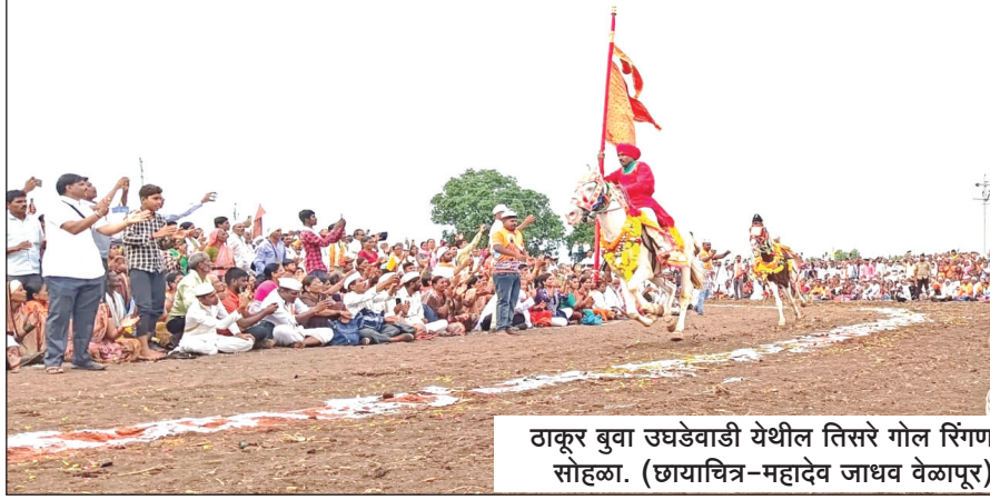
ठाकूर बुवा उघडेवाडी येथील तिसरे गोल रिंगण सोहळा.

ज्ञानबा माऊली तुकाराम असा आकाशाला गवसणी घालणारा आवाज, टाळ मृदंगाचा गजर, डौलाने फडकणाऱ्या भगवत्या पताका, अश्यांच्या पायाखालची माती मस्तकी लावण्यासाठी उडालेली झुंबड, देहभान वय विसरून नाचणारे भाविक अशा भक्तिमय वैतन्य माऊलीच्या पालखीचे तिसरे गोल रिंगण ठाकूर बुवा येथे रंगले.