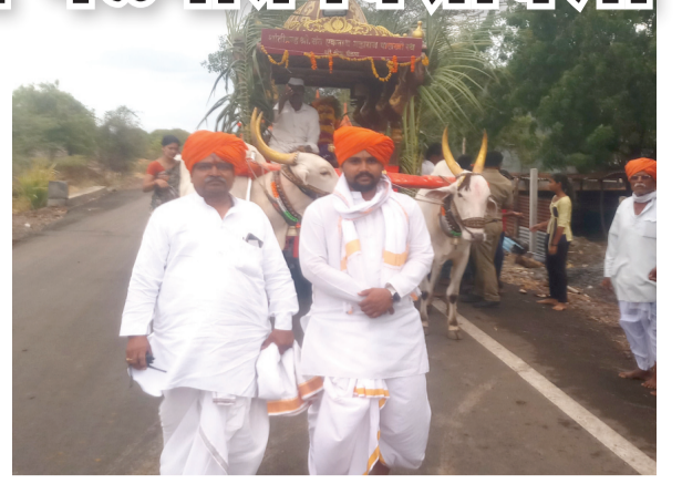
तिसऱ्या क्रमांकाचा पालखी सोहळा