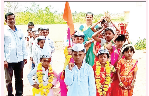
जाधव वस्ती जि. प. शाळेतर्फे बालदिंडीचे आयोजन