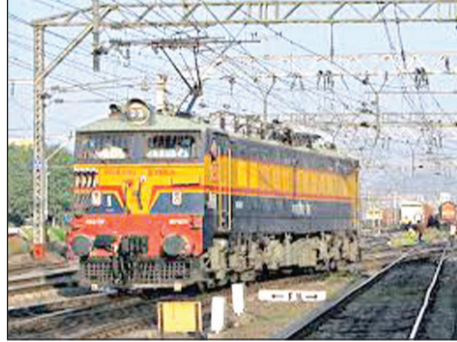
साप्ताहिक विशेष गाडी (क्रमांक ०१४३५५) ही ४ जुलै पर्यंत धावणार होती. आता ही

गाडी २६ जुलै पर्यंत धावणार आहे. सोलापूर-लोकमान्य टिकठ टर्मिनस (क्रमांक ०१४३६६) ही गाडी २८ जून पर्यंत धावणार होती. आता ही गाडी २६ जुलै पर्यंत धावणार आहे. सोलापूर-तिरुपती ही साप्ताहिक गाडी (क्रमांक ०१४३७७) ही २९ जून पर्यंत धावणार होती. आता ही गाडी २७ जुलै पर्यंत धावणार आहे. तिरुपती-सोलापूर ही गाडी ३० जून पर्यंत धावणार होती. आता ही गाडी २८ जुलै पर्यंत धावणार आहे.