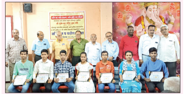
मुक्तेश्वर मंदिर ट्रस्टतर्फे गुणवंतांचा सत्कार