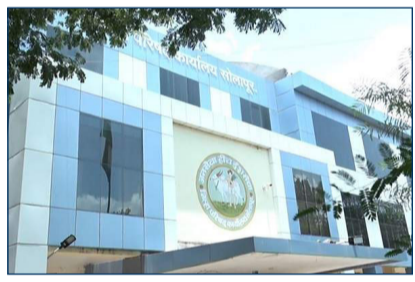
शिक्षण विभागाने आंतरजिल्हा बदलीने आलेल्या शिक्षकांचे समुपदेशन ही केले आहे. मात्र, त्यांना शाळेवर रुजू व्हायचे

हे आदेश अद्याप दिले नाही. त्यामुळे शिक्षकांना शाळेवर हजर होण्यासाठी अडचण ठरत आहे. १५ जून पासून शाळा सुरू झाल्या आहेत. जिल्ह्यातील ४८ शाळांमध्ये एक ही शिक्षक नाही तसेच १७४ शाळांमध्ये एकच शिक्षक शाळांमध्ये नियुक्त आहेत. त्यांना शाळेवर रुजू व्हायचे