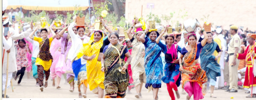
पालखी सोहळ्यात सहभागी झालेल्या महिलांनी डोक्यावर तुळस घेत धावा केला.