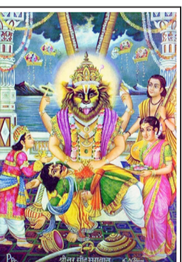
भगवान नृसिंह जयंतीनिमित्त कोटी-कोटी प्रणाम

शेतकऱ्यांसाठी संजीवनी असणारी जिल्हा मध्यवर्ती सहकारी बँक अर्थात डीसीसी बँक पुन्हा एकदा पूर्वपादावर आणायची असेल तर इतक्यात बँकेचा कारभार संचालक मंडळाच्या ताब्यात घ्यायला नको. आणखी किमान एक वर्ष तरी बँकेवर प्रशासक असायला हवा, तरच बँक आर्थिकदृष्ट्या सक्षम आणि सुदृढ होईल; असा दावा