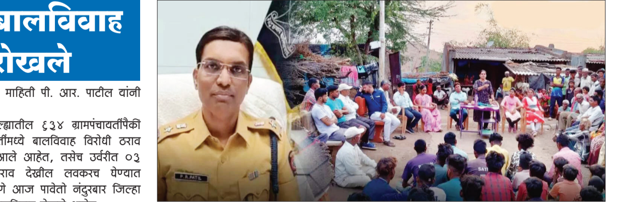
बालविवाहाचा प्रश्न गंभीर