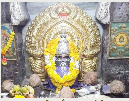
आज श्री शनैश्वर जयंती