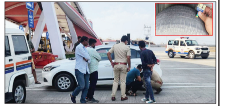
वाहनांचे टायर तपासले. त्यात टायरमधील रबरची घनता तपासण्यात आली.

समृद्धी महामार्गावर सातत्याने होणारे प्राणहानि अपघात सर्वसामान्य नागरिकांसह सरकारचीही चिंता वाढवत आहेत. त्यामुळे राज्याच्या परिवहन खात्याने अपघात नियंत्रणासाठी येथे आता आरटीओच्या मदतीने वाहनांची तपासणी, सक्तीने समुपदेशन सुरू केले आहे. त्याअंतर्गत गुरुवारी नागपूर आरटीओने 'ट्रेड हेथ इंडिकेटर'ने चारचाकी