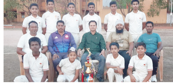
चांच्यात झाला. नीलेश गायकवाड क्रिकेट अकादमीने हा समा ना

पंढरपूर येथे झालेल्या चॅम्पियन ट्रॉफीमध्ये नीलेश गायकवाड क्रिकेट अकादमीने विजेतेपद पटकावले. यामध्ये ४ संघांनी सहभाग घेतला होता. अंतिम सामना नीलेश गायकवाड क्रिकेट अकादमी आणि पंढरपूरच्या नागेश साळुंके क्रिकेट अकादमी