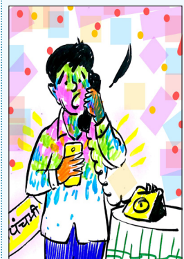
हॅलो, माझा मोबाईल 'फेस अनलॉक' होत नाहीये!