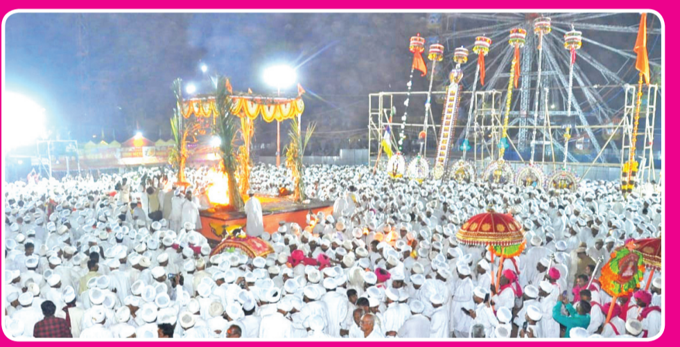
श्री सिद्धेश्वरच्या यात्रेच्या तिसऱ्या दिवशी होम मैदानावर होम प्रदीपन सोहळा भक्ती भावाने पार पडला.