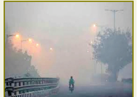
नागपूर, वाशिम, वर्धा, यवतमाळ जिल्हांतही थंडीचा कडाका कायम आहे. पुणे, सातारा, सांगली, महाबळेश्वर, सोलापूर, कोल्हापूर जिल्हातही किमान तापमानात घट झाली आहे.

किरणे अंगावर घेतली जातायत. त्यातच ऐज संक्रांतीच्या दिवशी वातावरणाने थंडीची भेट दिल्याने तीळगुळाचा गोडवाही लज्जतदार ठरला. राज्यात मागील काही दिवसांपासून उत्तरेकडून वाहणाऱ्या वाऱ्याचा वेग वाढल्याने थंडीचा तडाखा वाढतोय. यामुळे राज्यातील बहुतांश जिल्हांत थंडीची लाट आली आहे. यात मुंबई, पुणे, नाशिकमध्ये नागरिकांना बोचऱ्या थंडीचा अनुभव मिळत आहे. पुढील ८ दिवस थंडीची लाट कायम राहण्याची शक्यता आहे. मागील चार दिवसांपासून मध्य महाराष्ट्र, मराठवाडा, विदर्भत कोकणात थंडीची लाट आली आहे. विदर्भ आणि मध्य महाराष्ट्रातील नाशिक, नंदुरबार, जळगाव या जिल्हांत तसेच परभणी, गोंदिया, अकोला, बुलढाणा, ब्रह्मपुरी, चंद्रपूर,