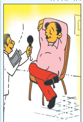
त्यांना तीळ टेकवून, गूल तुम्हीच खाव्हाल म्हणे?