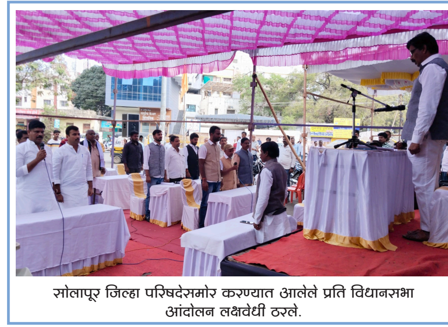
सोलापूर जिल्हा परिषदेसमोर करण्यात आलेले प्रति विधानसभा आंदोलन लक्षवेधी ठरले.

यांची विमानतळाच्या विशेष कक्षात भेट झाल्याची माहिती सूत्रांकडून मिळाली आहे. कर्नाटकचे मुख्यमंत्री बसवराज बोम्मई यांनी सोलापूर आणि सांगलीतील अनेक गावांवर दावा केलाय. विशेष म्हणजे काही गावे स्वतःहून कर्नाटकात जाण्यास इच्छुक आहेत. त्यामुळे राजकीय वातावरण तापले आहे. सीमावादाचा विषय सध्या न्यायप्रविष्ट आहे. सुप्रीम कोर्टात याबाबत सुनावणी सुरू आहे. असे असताना कर्नाटकच्या मुख्यमंत्र्यांनी हा वाद पुन्हा उरकून काढला आहे. या सगळ्या घडामोडींमध्ये दोन्ही राज्यांच्या मुख्यमंत्र्यांची सोमवारी झालेली प्रत्यक्ष भेट ही महत्त्वाची मानली जात आहे.