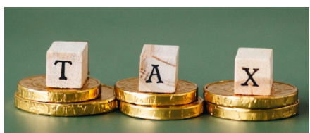
जिनापा गुरुपादपा गवसणे यांच्याकडील ५ लाख १७ हजार ७४० मिळकतकर धकबाकी पोटी ८ व्यावसायिक गाळे सील केले आहेत.

बेगम कमरुनिरसा कारीगर स्कूलच्या ५४ लाख ४७ हजार २२ रुपये धकबाकीपोटी संगणक लॅप,