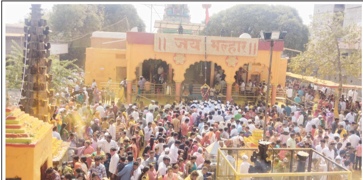
बाळे येथील खंडोबा मंदिरात रविवारी दर्शनासाठी भाविकांनी मोठी गर्दी केली होती.