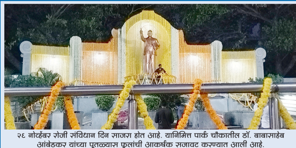
२६ नोव्हेंबर रोजी संविधान दिन साजरा होत आहे. यानिमित्त पार्क चौकातील डॉ. बाबासाहेब आंबेडकर यांच्या पुतळ्यास फुलांची आकर्षक सजावट करण्यात आली आहे.

सोलापूर : कॉलेजला निघालेली १७ वर्षाची अल्पवयीन मुलगी दुपारी तीन पर्यंत कॉलेजमध्ये होती. मात्र दुपारनंतर ती घरात परतलीच नाही. ही घटना दि.१५ नोव्हेंबर रोजी घडली.त्यावेळी त्या पीडित मुलीच्या आईने व नातेवाईकांनी सर्वत्र पाहणी करून शोध घेतला असता, ती मिळून आली नाही. या प्रकरणी पीडित मुलीच्या आईने एमआयडीसी पोलीस ठाण्यात फिर्याद दाखल केली आहे.