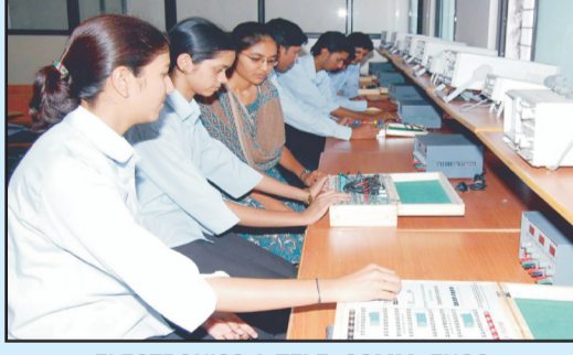
ELECTRONICS & TELE. COMM. ENGG.