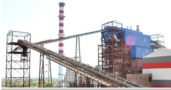
चिमणी प्रकरणी सोमवारी एनजीपीकडेही सुनावणी होती. तिथेही कारखान्याच्यावतीने पुढील तारखेची मागणी करण्यात आली. त्यावेळी एनजीपीनेही सतत पुढच्या तारखेच्या मागण्या करत असल्याबद्दल कारखान्याला सुनावल्याची माहिती आहे.