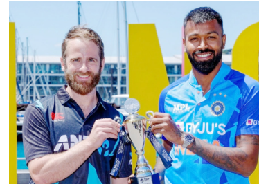
ज्यामुळे पहिला सामना झालाच नाही. पण दुसरा सामना काहीशा व्यत्ययानंतर अखेर पार पडला. भारत आणि न्यूझीलंड यांच्यात २२ नोव्हेंबर

नवी दिल्ली : भारत आणि न्यूझीलंड यांच्यातील टी२० मालिका आता अंतिम टप्प्यात पोहोचली आहे. पहिला सामना पावसातून रद्द झाल्यावर दुसरा सामना भारताने जिंकला. आता अखेरचा सामना उद्या अर्थात मंगळवारी २२ नोव्हेंबर रोजी खेळवला जाणार आहे. भारताने हा सामना जिंकल्यास मालिकाही भारत जिंकेल तर न्यूझीलंडने सामना जिंकल्यास मालिका अनिर्णित सुटणार आहे.