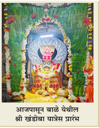
आजपासून बाळे येथील श्री खंडोबा यात्रेस प्रारंभ