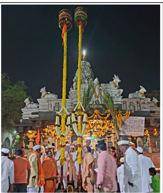
बाळीवेस येथील मल्लिकार्जुन मंदिरात पहिल्या व दुसऱ्या नंदी ध्वजाच्या सराव काठीचे पूजा करून यात्रेच्या तयारीला सुरुवात