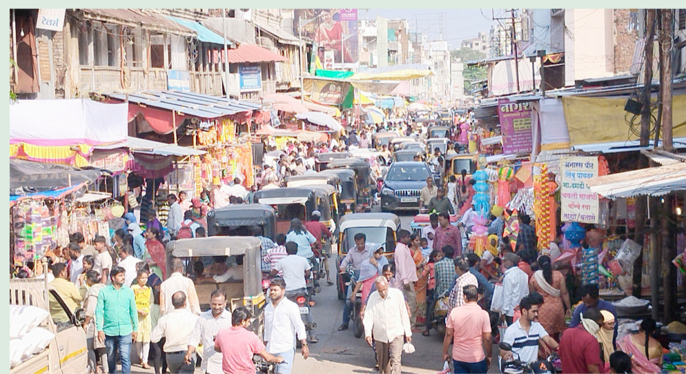
दिवाळीसणानिमित्त सोलापूरकर खरेदीसाठी गर्दी करत आहेत. त्यामुळे बाजारपेठेत वाहतुकीची कोंडी होत आहे. शनिवारी दिवसभर टिकक चौकात अशीच परिस्थिती दिसून आली.

रुग्णालयात दाखल करण्यात आले होते. शुक्रवारी दुपारी डिस्चार्ज घेतल्यानंतर तो घरी आला.आणि सर्वांना भेटून तो बाहेर जाऊन होता, असे सांगून घराबाहेर पडला तो. त्यानंतर त्याचा मृतदेह आज सकाळी विहिरीत आढळून आला. तो मजुरी करीत होता. त्याच्या पश्चात पत्नी आणि एक मुलगा असा परिवार आहे. आजाराच कंटाळून त्याने आत्महत्या केली. अशी प्राथमिक नोंद एमआयडीसी पोलिसात झाली. हवालदार चव्हाण तपास करीत आहेत.