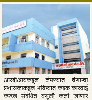
आरबीआयकडून नेमण्यात येणाऱ्या प्रशासकांकडून भविष्यात कडक कारवाई करून संबंधित वसुली केली जाणार

लक्ष्मी बँकेच्या विलिनीकरणासाठी पुणे, मुंबई येथील बँका तयार होत्या. अशातच आरबीआयकडून परवाना रद्द झाला. त्यामुळे लक्ष्मी बँक विलिनीकरणासाठी बँका इच्छुक असताना परवाना रद्द झाल्याने पुढे काय? असा प्रश्न ठेवीदार, कर्मचारी, नागरीक यांच्यापुढे उपस्थित झाला होता. परंतु परवाना रद्द झाला असला, तरी इच्छुक बँका 'ड्यु डेलिगन्स रिपोर्ट' घेऊन पुढील एक वर्षांपर्यंत आरबीआयकडे विलिनीकरणासाठी इच्छुक असल्याचा प्रस्ताव पाठवू शकतात. आणि त्यानंतर पुढील वर्षांपर्यंत लक्ष्मी बँक विलिनीकरण करून घेऊ शकतात. त्यामुळे लक्ष्मी बँक विलिनीकरणाचा मार्ग पुढील वर्षांपर्यंत मोकळा असल्याचे चित्र आहे.