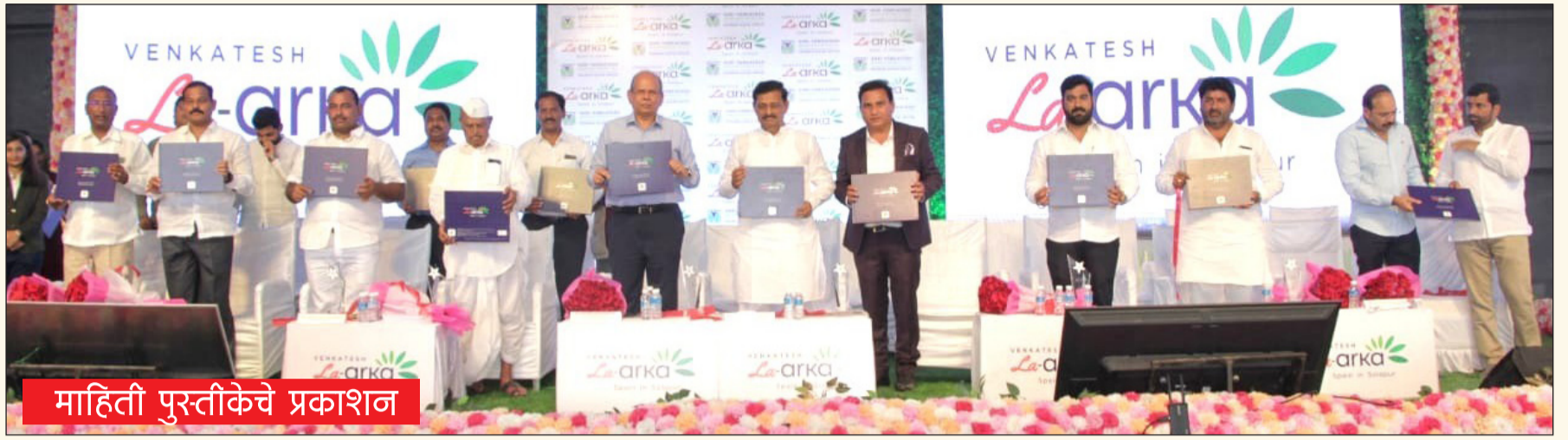
माहिती पुरस्तीकेचे प्रकाशन