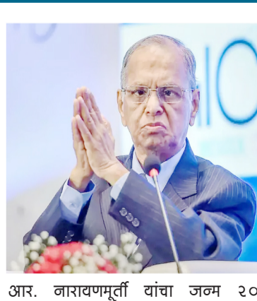
आर. नारायणमूर्ती यांचा जन्म २० ऑगस्ट १९४६ मध्ये कर्नाटकातील

सिद्दलापतामध्ये झाला. मध्यमवर्गीय कुटुंबात जन्मलेले नारायण मूर्ती ८ भावंडांमध्ये पाचव्या नंबरवर होते. शालेय शिक्षण पूर्ण केल्यानंतर त्यांनी १९६७ मध्ये नॅशनल इन्स्टिट्यूट ऑफ इंजिनिअरिंग, मैसूर युनिव्हर्सिटीमधून इलेक्ट्रिकल इंजिनिअरिंगची पदवी घेतली. त्यानंतर १९६९ मध्ये आयआयटी कानपूरमधून एमटेक केलं. त्यानंतर त्यांनी १९७० च्या अखेरीस पुण्याच्या पाटली कम्प्युटर्समध्ये असिस्टंट मॅनेजर म्हणून नोकरीची सुरुवात केली. एन. आर. नारायण मूर्ती यांचा विवाह