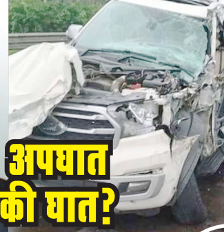
अपघात की घात?